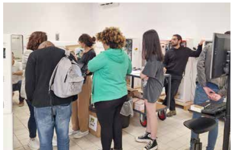
Visite entreprise Cap Monétique en partenariat avec la Mission Locale de Loches

Toute l'équipe d'ETS vous souhaite une très belle année 2025!!