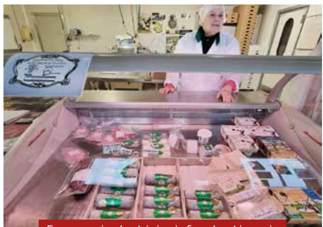
Fromage, viande et épicerie fine chez Limouzin