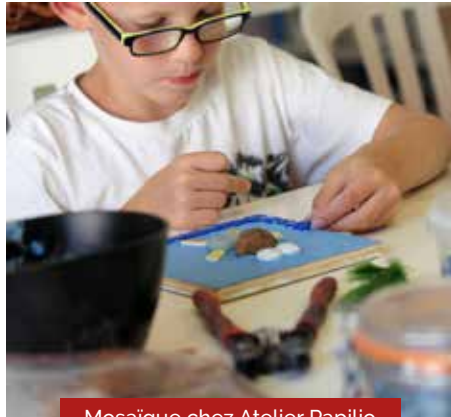
Mosaïque chez Atelier Papilio