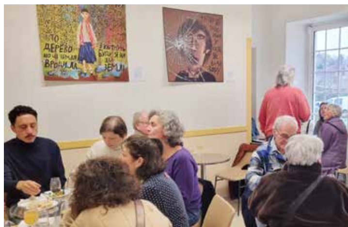
Fête Saveurs et Traditions