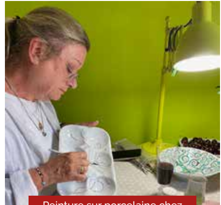
Peinture sur porcelaine chez Atelier Fleur de Lys