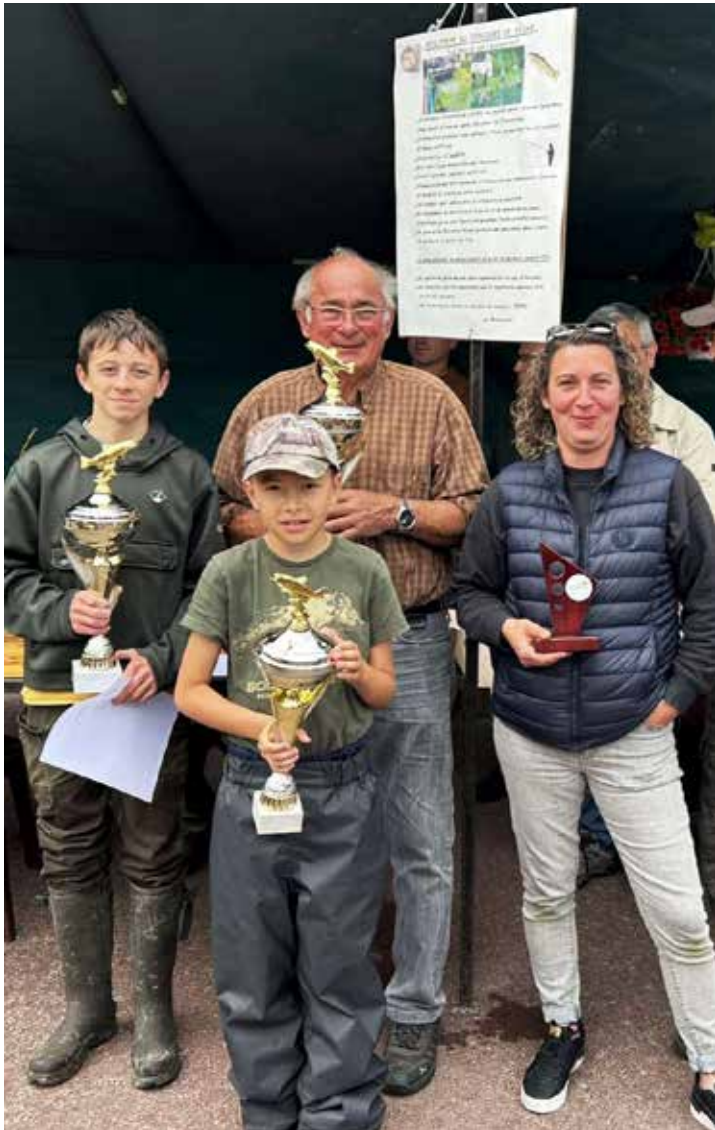
Les gagnants du concours 2024 catégories enfant, mineur, adulte femme et adulte homme. Bravo !

L'année 2024 a commencé avec ces débordements de nos rivières qui ont bien compliqué les rempoissonnements. Nous avons été obligés de changer